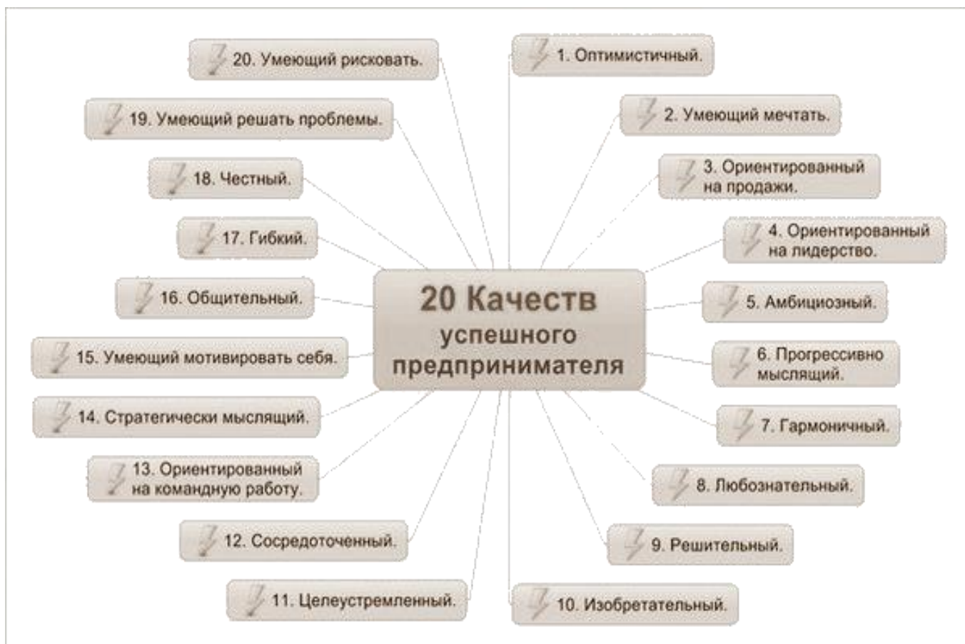
Рисунок 2 – Личностные качества предпринимателя

Предпринимательской деятельностью занимается много людей. Они разные по характеру, привычкам, ценностям, образу мыслей. Однако всем им вне зависимости от вида деятельности присущи общие черты, позволяющие выделить «обобщенный портрет» предпринимателя с присущими ему характеристиками (рис. 2).