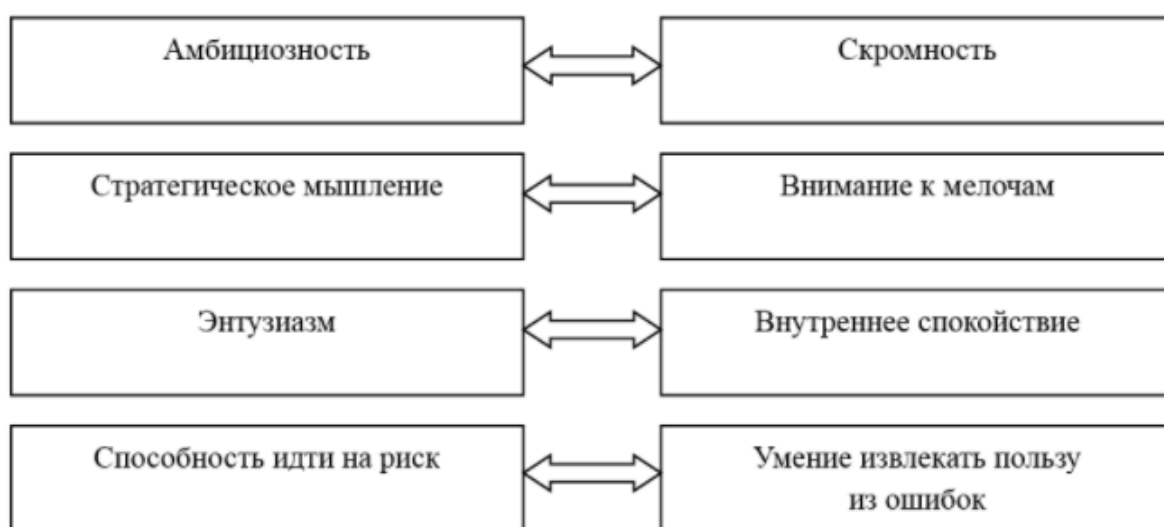
Рисунок 3 – Взаимосвязь взаимоисключающих качеств предпринимателя

Успешный руководитель должен всегда уметь находить оптимальный баланс между двумя крайностями. Большинство наиболее успешных лидеров бизнеса обладают шестью нижеприведенными парами качеств , которые на первый взгляд кажутся взаимоисключающими друг друга. Самый интересный момент заключается в том, что любое из данных качеств, при своем развитии превращается в недостаток, и только в балансе со своей противоположностью обретает гармонию и ведет к успеху (рисунок 3).